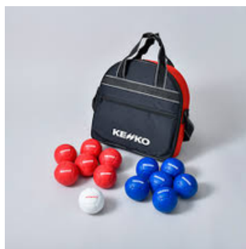
レクリエーション ボッチャ 貸出料：1,000円