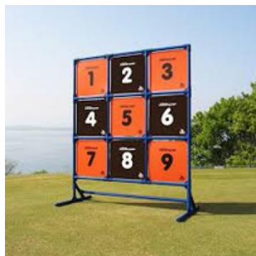
ディスゲッター 貸出料：2,000円