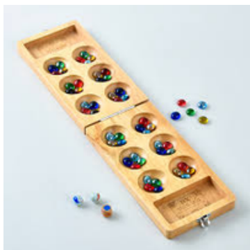
マンカラ 貸出料：500円