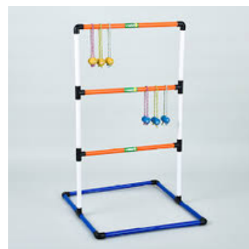
ラダーゲッター 貸出料：1,000円