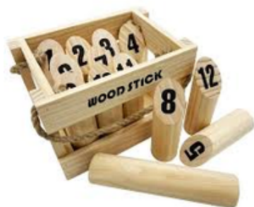
モルック 貸出料：500円